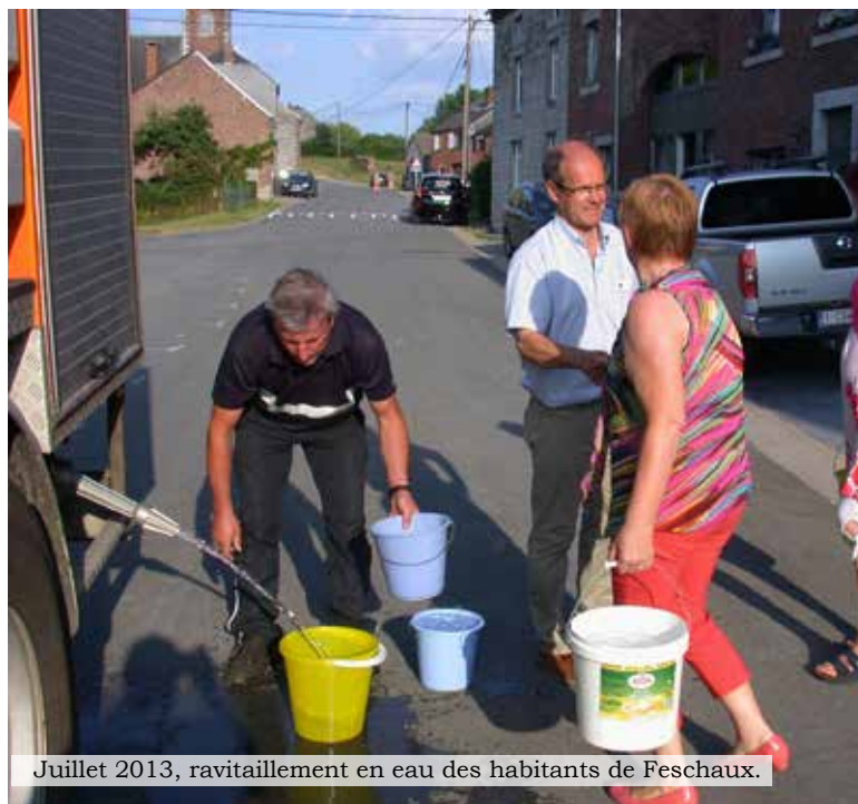
Juillet 2013, ravitaillement en eau des habitants de Feschaux.

La technique est assez récente et peu usitée en Wallonie, ce qui explique le temps nécessaire avant sa mise en service. Elle a été testée fin février dans les trois villages concernés; une belle avancée technologique qui, nous l'espérons, permettra d'améliorer de manière efficace la qualité de l'eau fournie aux habitants de nos villages.