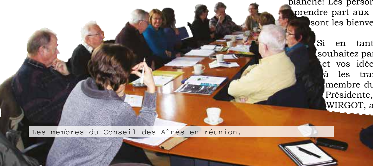
Les membres du Conseil des Aînés en réunion.